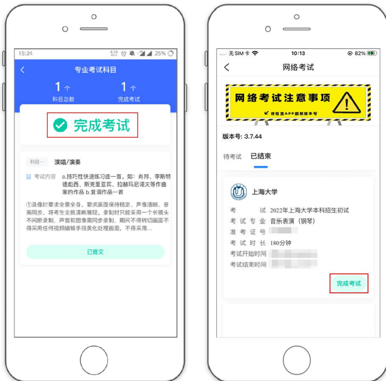
(主机显示完成考试)