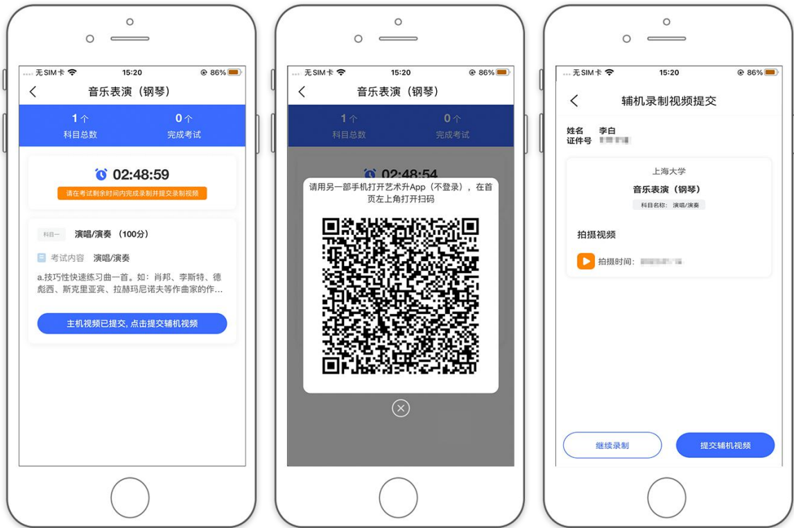
(辅机扫码重新回到提交辅机页面)