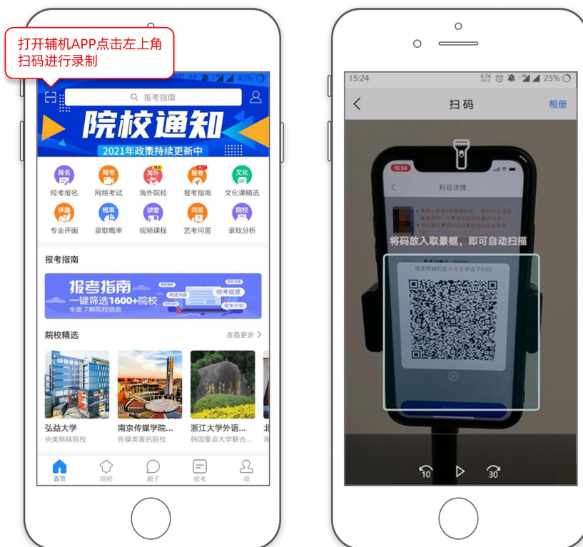
(打开辅机进行扫码)

回到主机机位，主机这个时候会要求考生进行 实人认证 ，按照提示进行操作，通过认证后进入录制界面，点击 “开始录制” 按钮，开始录制考试视频（ 根据语音指令的提示，进行横屏或竖屏录制 ）。